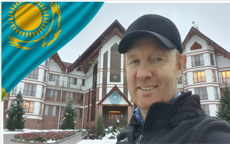
- stedet hvor præstesamling i Almaty holdes i oktober 2021

I øjeblikket støtter jeg 12 pastorer i Kasakhstan med mentortjeneste. Tre pastorer i Usbekistan, to pastorer i Kirgisistan, og en pastor i Georgien. Disse 18 pastorer er jeg i kontakt med næsten hver uge. Ud over disse har jeg også kontakt med og støtter mange flere pastorer og menighedsplantere her i Central-Asien med råd, samtaler og besøg. Med andre ord er mit netværk meget stort, og ofte har jeg også rådgivet andre typer missionsarbejde her i regionen, som har haft brug for assistance.