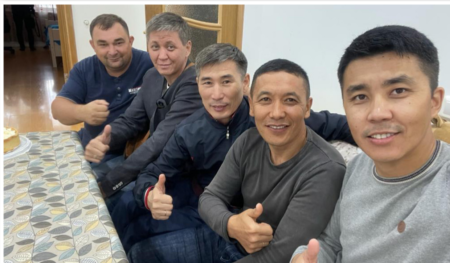
- pastorsamling i VestKasakhstan