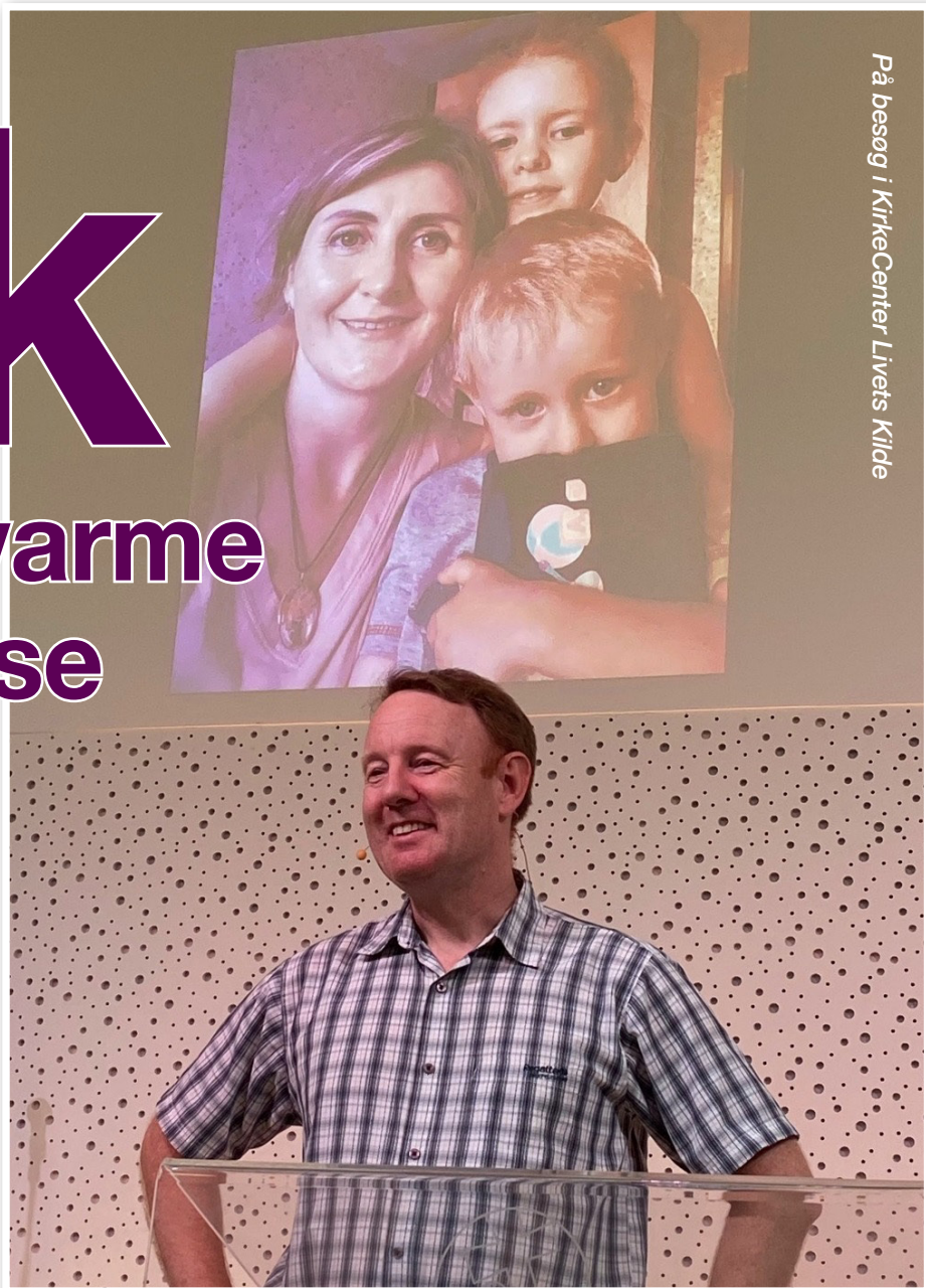
På besøg i KirkeCenter Livets Kilde