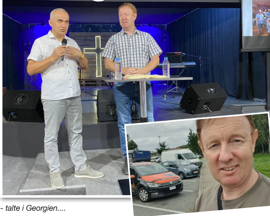
- talte i Georgien....