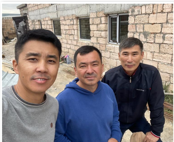
- 3 pastore her i vest Kasakhstan foran kirkebyggeri i byen Aktau