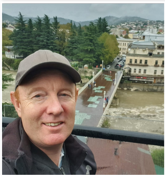
- billedet her er fra Georgien